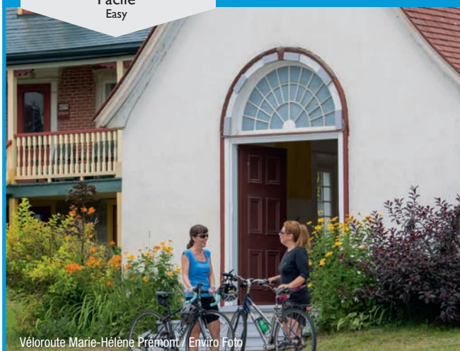
Véloroute Marie-Hélène Prémont